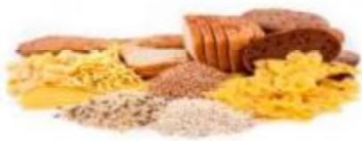
گروه نان و غلات

این گروه شامل انواع نان، برنج، ماکارونی، آرد، جو، سیب زمینی و بلال است. مصرف کافی و به اندازه از این گروه به دلیل داشتن انرژی زیاد و پروتئین کم برای شما بیمار عزیز مفید خواهد بود. البته باید بدانید که برای پیشگیری از ابتلا به چاقی در مصرف آنها زیاده روی صورت نگیرد.